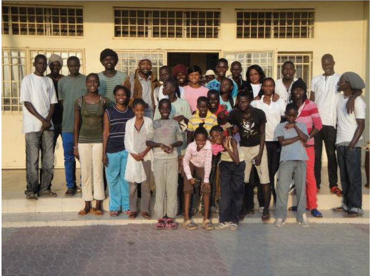
Le groupe « jeunes » avec leurs intervenants devant la porte du Centre Culturel régional de Thiès