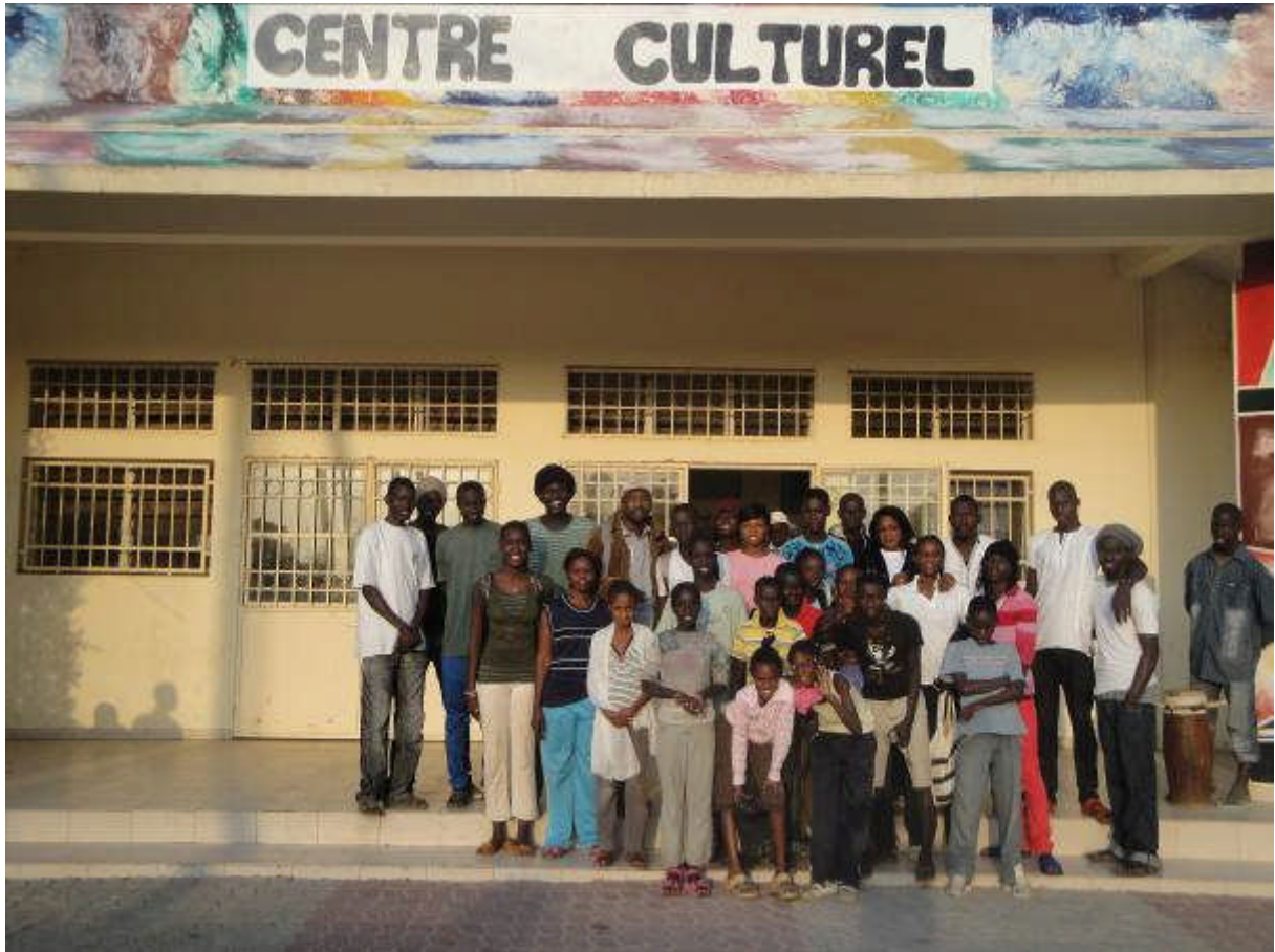
Le groupe jeune pose devant le Centre Culturel de Thiès