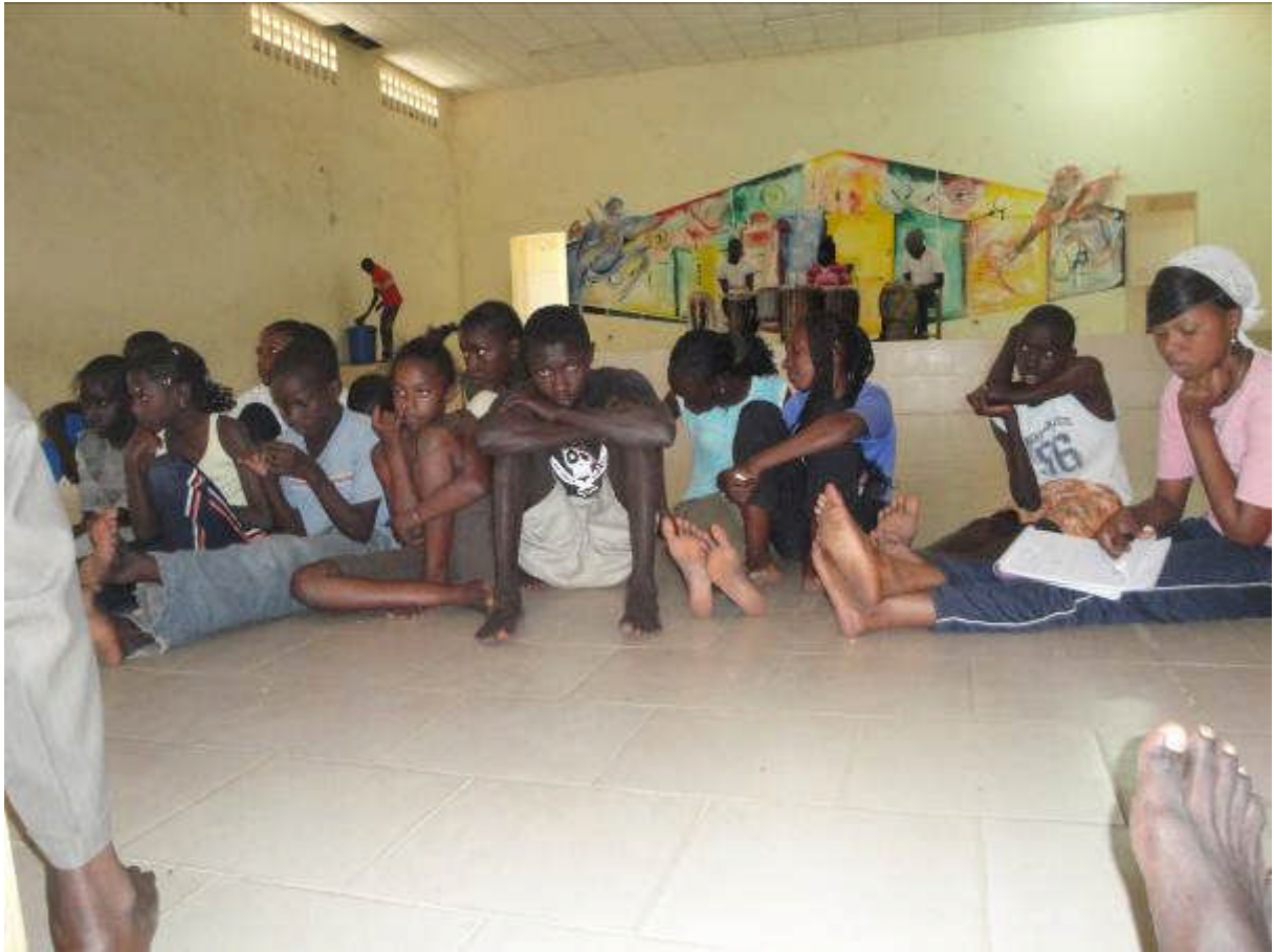
Le groupe « Jeunes » à l'écoute des consignes d'improvisation qu'ils doivent effectuer en wolof puis en français